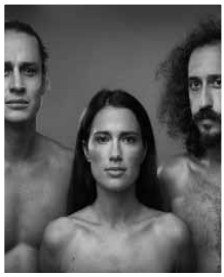
Fr. 2. 11. ZAP Bogan Swing Theater

Yorckstraße 15 · 10965 Berlin - Kreuzberg · Phone 215 80 70 · www.yorckschloessen.de