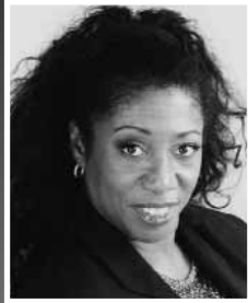
Sa 3. 11. Donna Brown & The Black Pearls