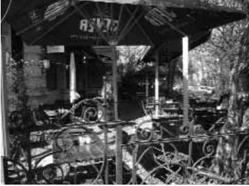
Der ideale Rückzugsort: Unser Sommergarten

Wie die Spatzen von den schattigen Bäumen zwitschern, hat der Jahrhundert-Sommer hier im Hause einen neuen Umsatz-Rekord hervorgerufen. Obwohl halb Berlin in den Ferien war, füllte sich der Biergarten täglich in Windeseile. Unser Super-Team kam des öfteren an seine physischen Grenzen. Insbesondere die Jungs in unserer kleinen Küche leisteten bei Wüsten-Temperaturen Übermenschliches! Bei derartigem Massenansturm kommt es dann zwangsläufig zu erheblichen Wartezeiten. Wir danken allen, die geduldig auf Getränke und Speisen gewartet haben!! In der Zwischenzeit hat sich die Lage